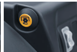
Spoljno uključenje PTO & prekidač u 3 položaja (levo / desno)