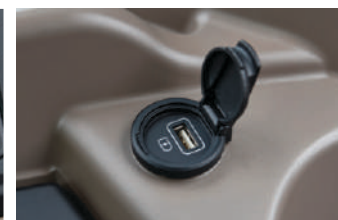
USB punjenje + strujna utičnica