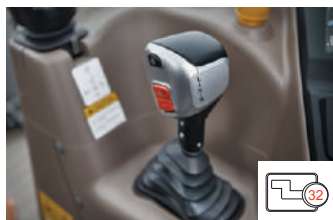
32-brzine prenosa (8 brzina x 2 polovljena x 2 brzine)