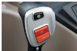
Power shift (8 brzina)