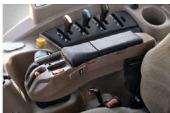
Elektronski naslon za ruke