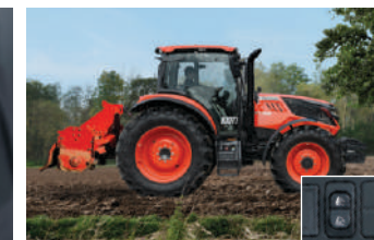
Elektronsko podizanje i spužanje