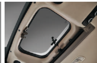
Široki providni krovni otvor