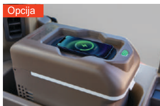
Opcija Kutija za toplo i hladno skladištenje sa bežičnim punjenjem mobilnog telefona