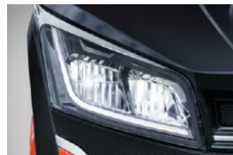
Full LED farovi