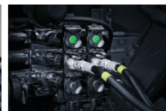
14 hidrauličnih priključaka (2 su opcione)