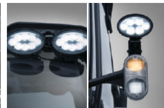
LED prednja radna svetla / zadnja radna svetla