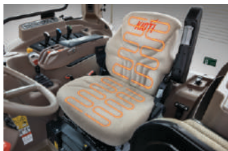
Premijum sedište sa grejanjem