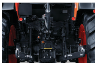
4,410 kg·podizna moć