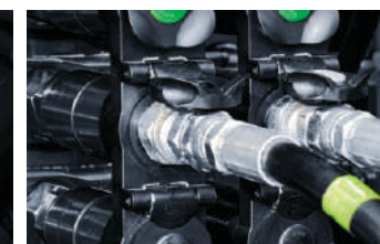
Jednoručna brza spojnica