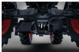
Prednja osovina LSD