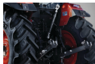
Elektronsko upravljanje u 3 tačke