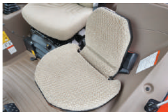
Pomoćno sedište sa automatskim sklapanjem