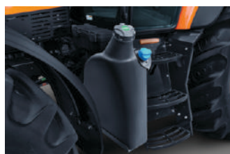
230ℓ kapacitet rezervoara za gorivo